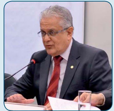
Deputado Geraldo Thadeu (MG)

geral de Hepatites Virais do Ministério da Saúde, concordou com Eleuses. “Vamos ter mais facilidade para adquirir esses antivirais, se tivermos maior número de pacientes diagnosticados. Isso reduz o número de óbitos e gera melhor condição para negociar”, frisou.