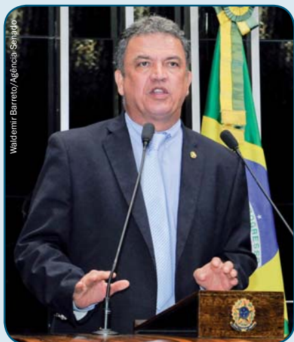
Senador Sérgio Petecão (AC)

O plenário do Senado aprovou, na quarta-feira (23), em dois turnos,