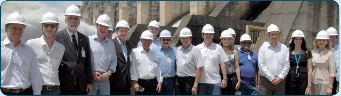
Comitiva verifica in loco funcionamento de eclusa na Usina Hidrelétrica de Tucuruí

Parlamentares da comissão especial que analisa a regulamentação da transposição de desníveis dos rios para transporte hidroviário (PL 5.335/09), visitaram, na quinta-feira (24), a Usina Hidrelétrica de Tucuruí (PA), responsável por 10% da capacidade energética instalada no Brasil e dona da maior eclusa do país.